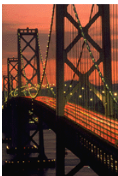
Didascalia dell'immagine o della fotografia

Inserire informazioni dettagliate sull'organizzazione e una breve descrizione di prodotti o servizi specifici nelle facciate interne. Il testo deve essere incisivo in modo da attirare l'attenzione del lettore.